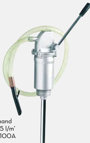
Piston hand pump 35 l/m' F0035100A