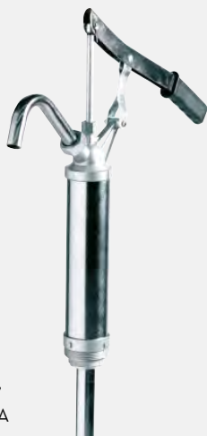
Piston hand pump 25 l/m' F0034900A