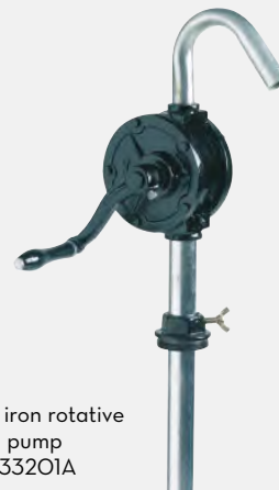
Cast iron rotative hand pump F0033201A