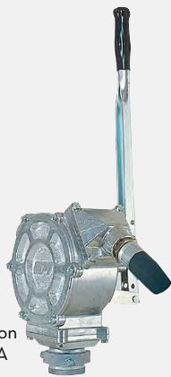
PM GPI Piston F0031600A