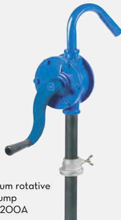
Aluminium rotative hand pump F0033200A